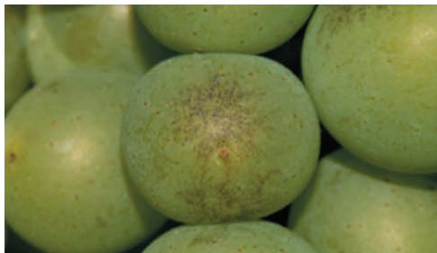
LISZTHARMAT FERTŐZÉSTŐL MEGTISZÍTOTT BOGYÓ

A VitiSan SP® gombakórokozók elleni megelőző és eradikatív hatású kontakt gombaölő szer és makrotápelem szolgáltató készítmény. A hatás elsősorban a növényfelszínen található gombamicélium és a spórák elleni dehidratáló hatáson alapul. A kezelt növényfelszínen kialakuló lúgos kémhatás gátolja a betegséget okozó gombák megtelepedését. A kórokozók kezelése a VitiSan SP® -vel pedig azok képleteinek kiszáradását eredményezi, illetve megakadályozza a fertőzést.