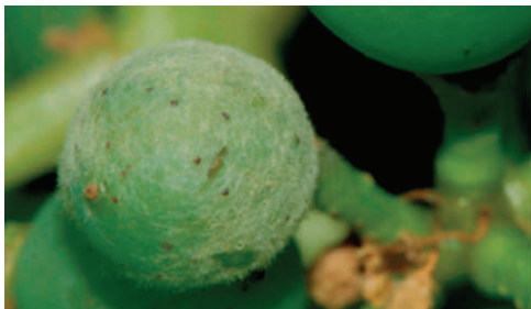
LISZTHARMATTAL FERTŐZÖTT BOGYÓ KEZELÉS ELŐTT